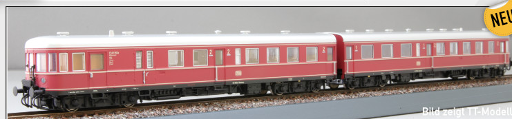
Bild zeigt TT-Modell