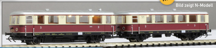
Bild zeigt N-Modell

weitere Ausführungen dieser Baureihe erhältlich