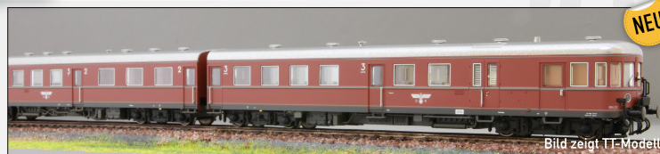
Bild zeigt TT-Modell