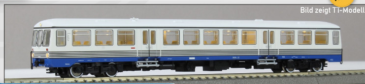
Bild zeigt TT-Modell

weitere Ausführungen dieser Baureihe erhältlich