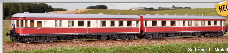
Bild zeigt TT-Modell