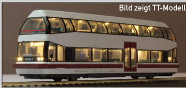
Bild zeigt TT-Modell