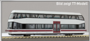
Bild zeigt TT-Modell