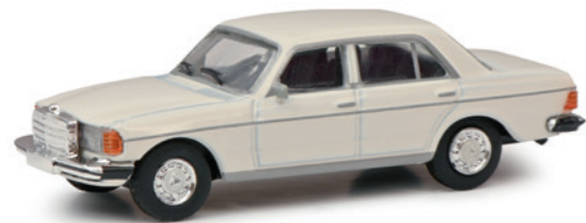
Mercedes-Benz W123 Limousine * 45 203 8100