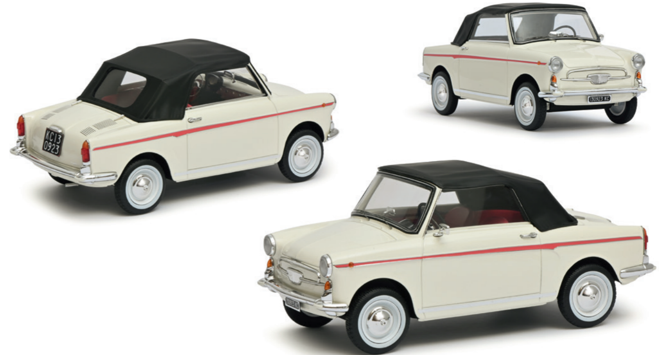
Autobianchi Cabriolet Autobianchi convertible

The Schuco PRO.R18 series offers a range of exceptional and finely designed models of limited production vehicles. Thanks to this high-quality modelling material, it is possible to reproduce very rare and exotic original vehicles with a very high level of detail and quality of finish throughout.