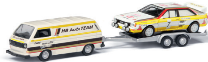
45 267 1800 * VW T3 "HB Audi Team" mit Anhänger und Audi Quattro A2 VW T3 "HB Audi Team" w. trailer and Audi Quattro A2