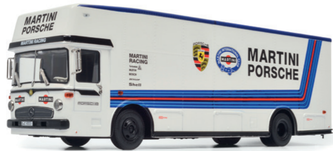
Mercedes-Benz Renntransporter MARTINI * 45 203 8000 Mercedes-Benz racing transporter MARTINI