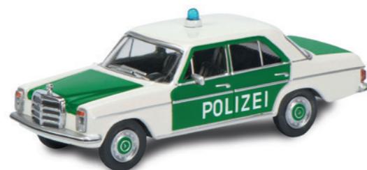
Mercedes-Benz -J8 POLIZEI * 45 203 7400