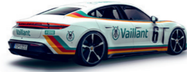
45 267 7300 ** Porsche Taycan Turbo S "Vaillant" weiß #6 Porsche Taycan Turbo S "Vaillant" white #6