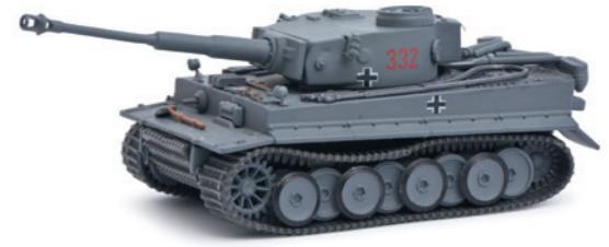
45 267 2200 PanzerkampfwagenVI "Tiger" grau Tank "Tiger", grey