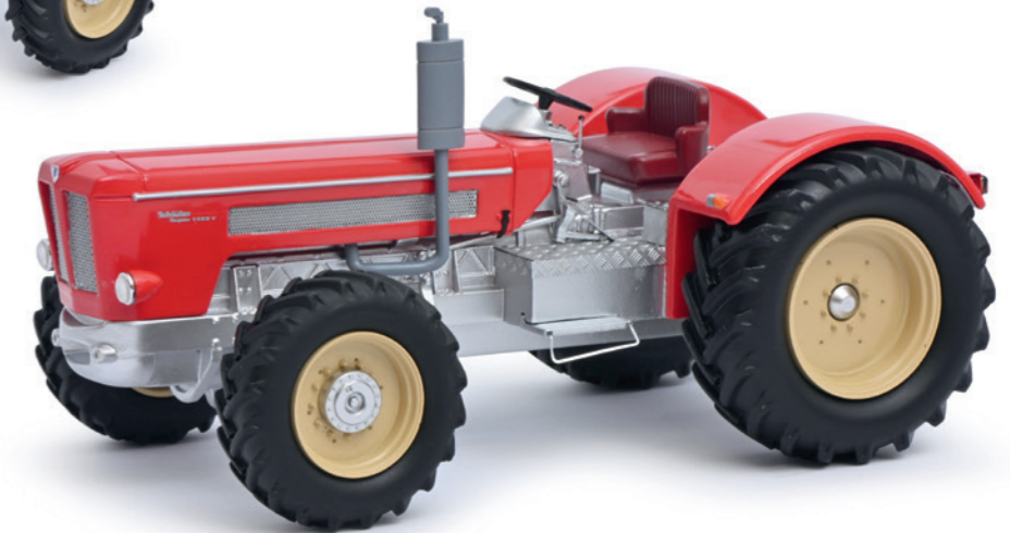
Schlüter Super 1500V