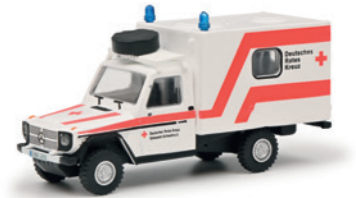
45 266 8600 Mercedes-Benz G Krankenwagen Mercedes-Benz G boxtruck, "Red Cross"