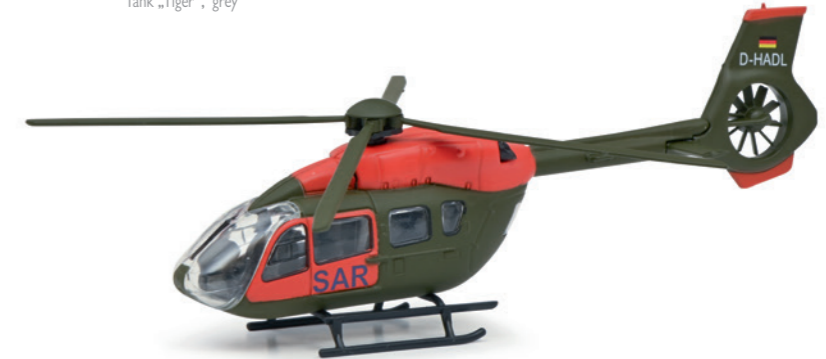
Airbus Helikopter H145 SAR * 45 268 0900