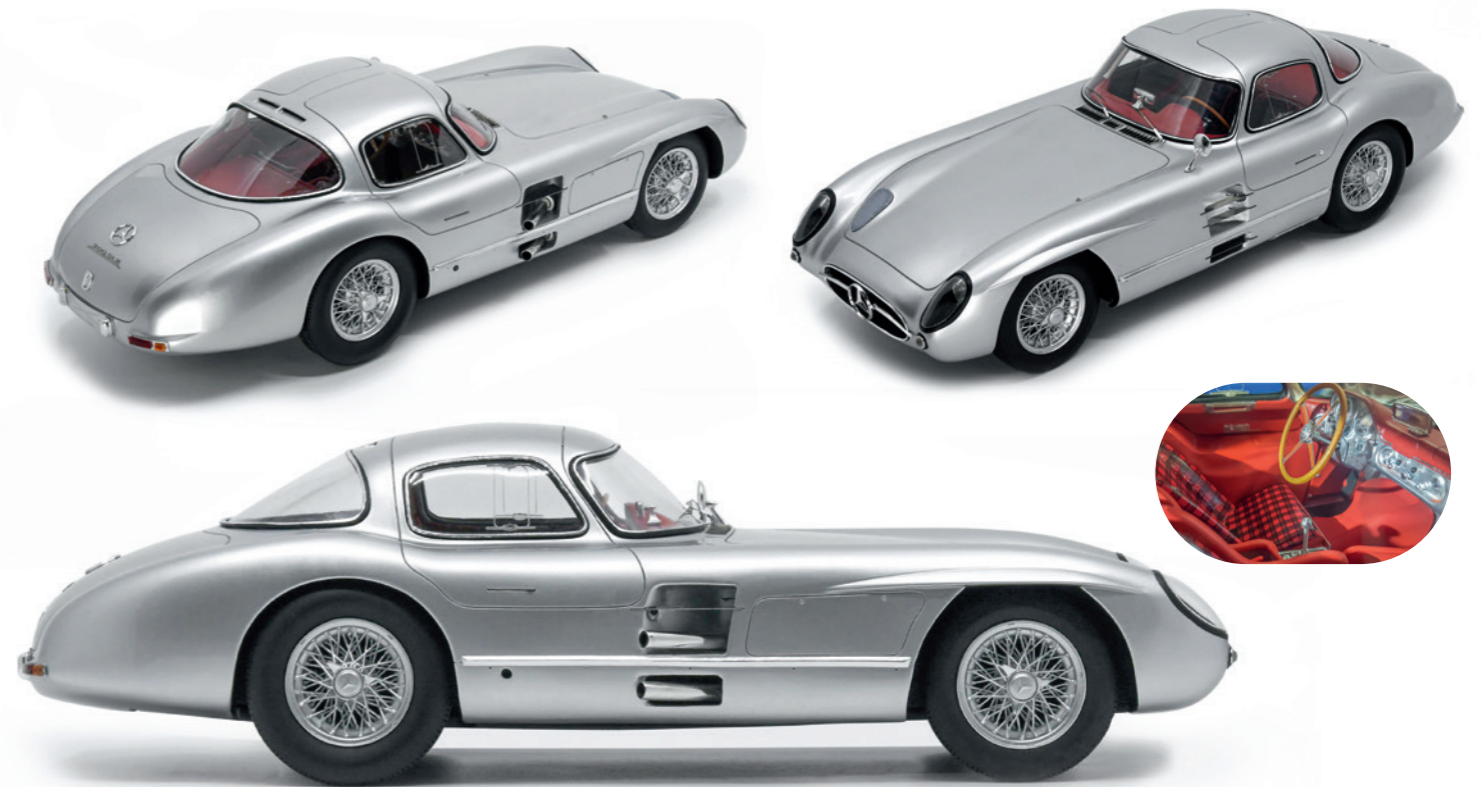
Mercedes-Benz SLR Uhlenhaut Coupé