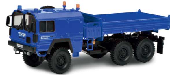
45 267 9400 * LKW 7t gl KAT I Kipper "THW" LKW 7t gl KAT I dumper "THW"