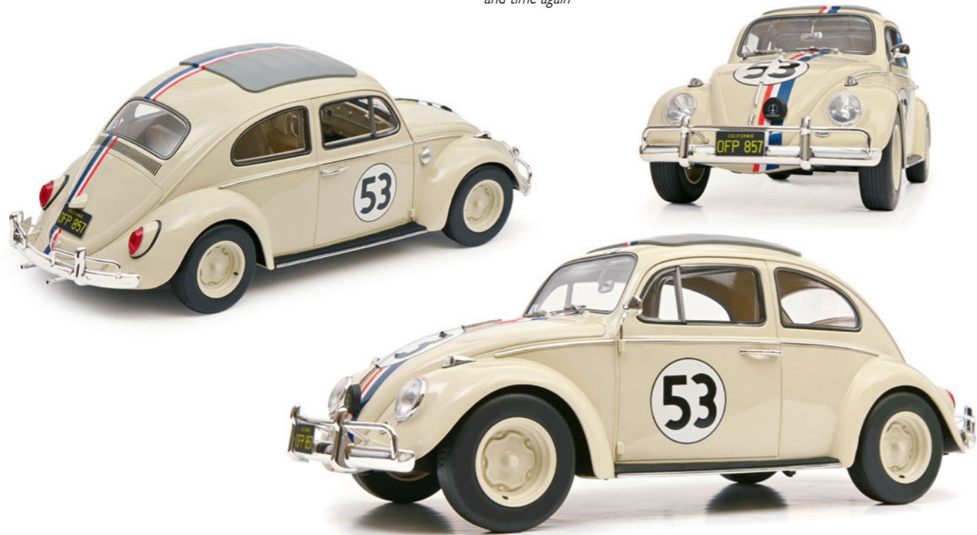
Volkswagen Käfer Nr. 53 Volkswagen Beetle No. 53

SCHUCO offers a wide range of high-quality and highly detailed zinc die-cast models in the popular 1:18 scale. EDITION 1:18 presents historic production vehicles and racing cars, as well as tractors and utility vehicles with a high degree of accuracy and attention to detail. Based on original vehicles from leading manufacturers, such as Porsche and Volkswagen, to name just two examples, SCHUCO is able to produce exceptional and very interesting new models time and time again