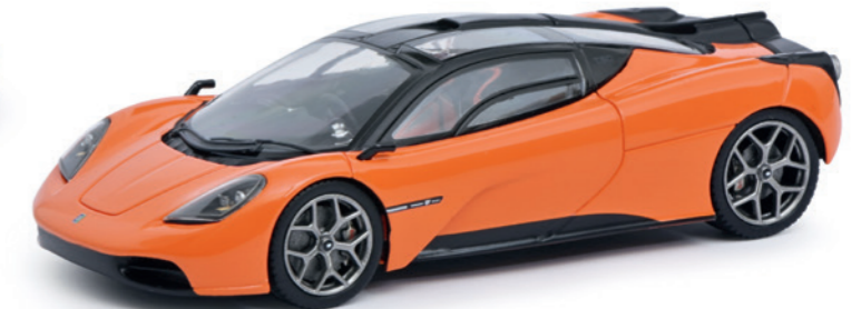
Gordon Murray T50