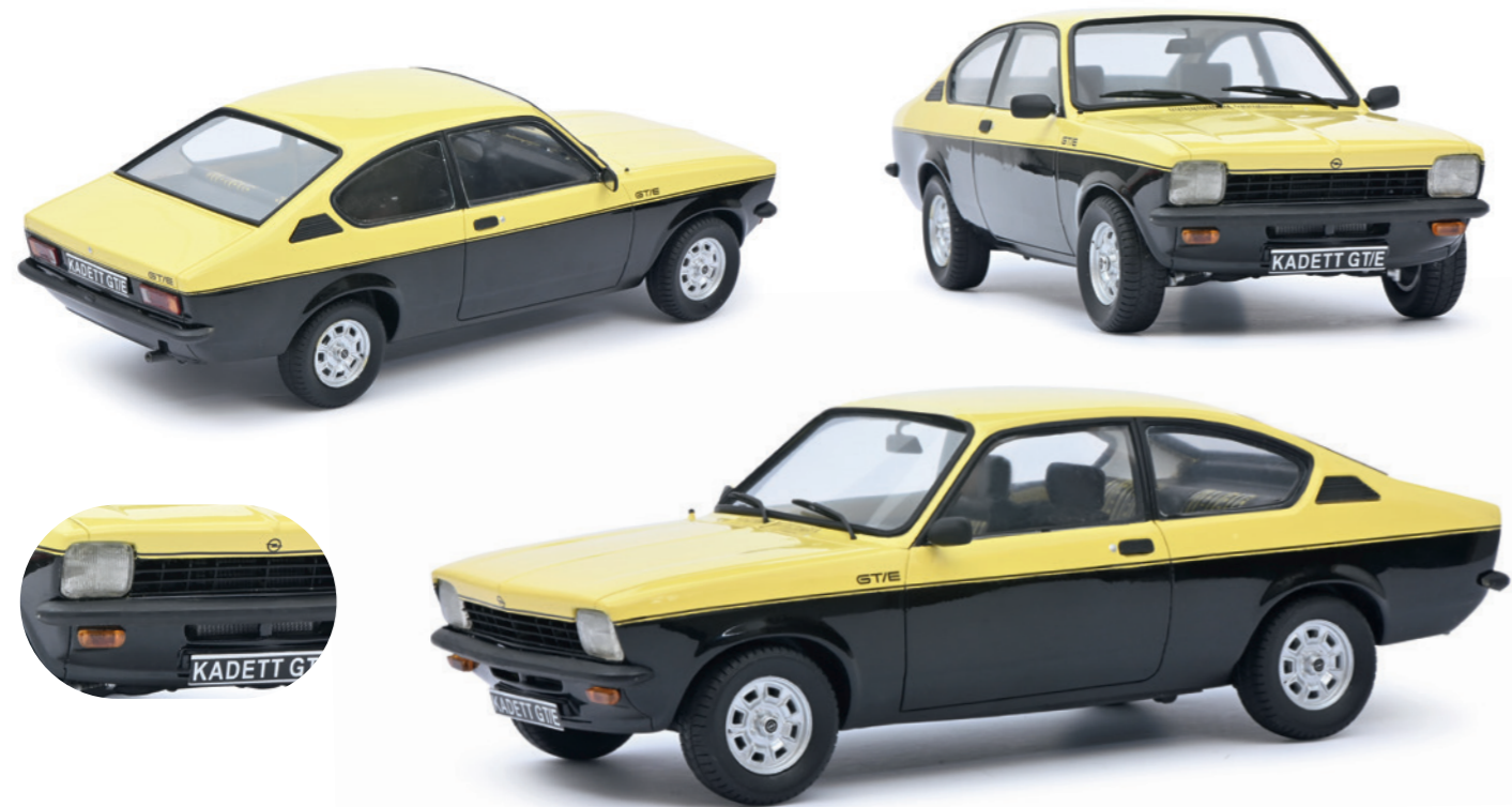
Opel Kadett GTE