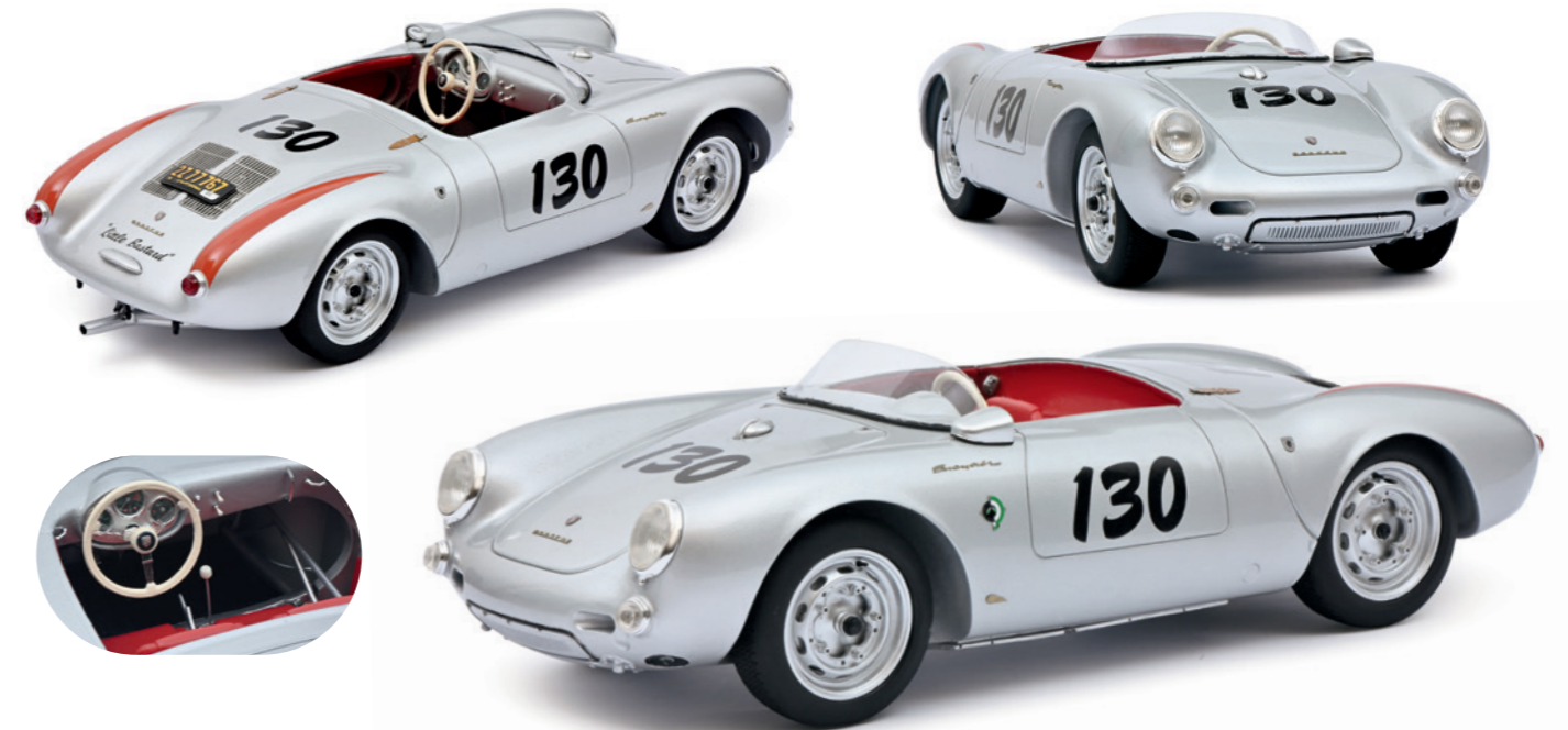
Porsche 550 Spyder

The Schuco PRO.R12 series offers a range of exceptional and finely designed models of limited production vehicles. Thanks to this high-quality modelling material, it is possible to reproduce very rare and exotic original vehicles with a very high level of detail and quality of finish throughout.