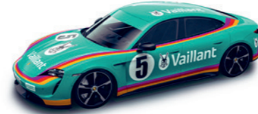
45 267 7200 ** Porsche Taycan Turbo S "Vaillant" grün, #5 Porsche Taycan Turbo S "Vaillant" green, #5

From vintage tractors to the sportcars, the Schuco Edition 1:87 series offers a wide range of highly detailed metal-made modelcars. These models are the perfect choice for model railway enthusiasts, diorama makers and die-cast model collectors.