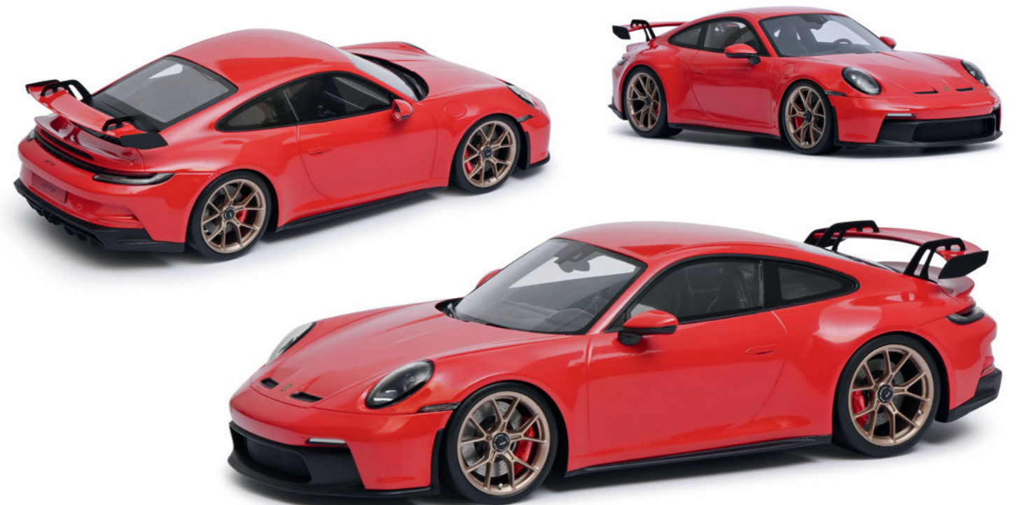
Porsche 911 GT3