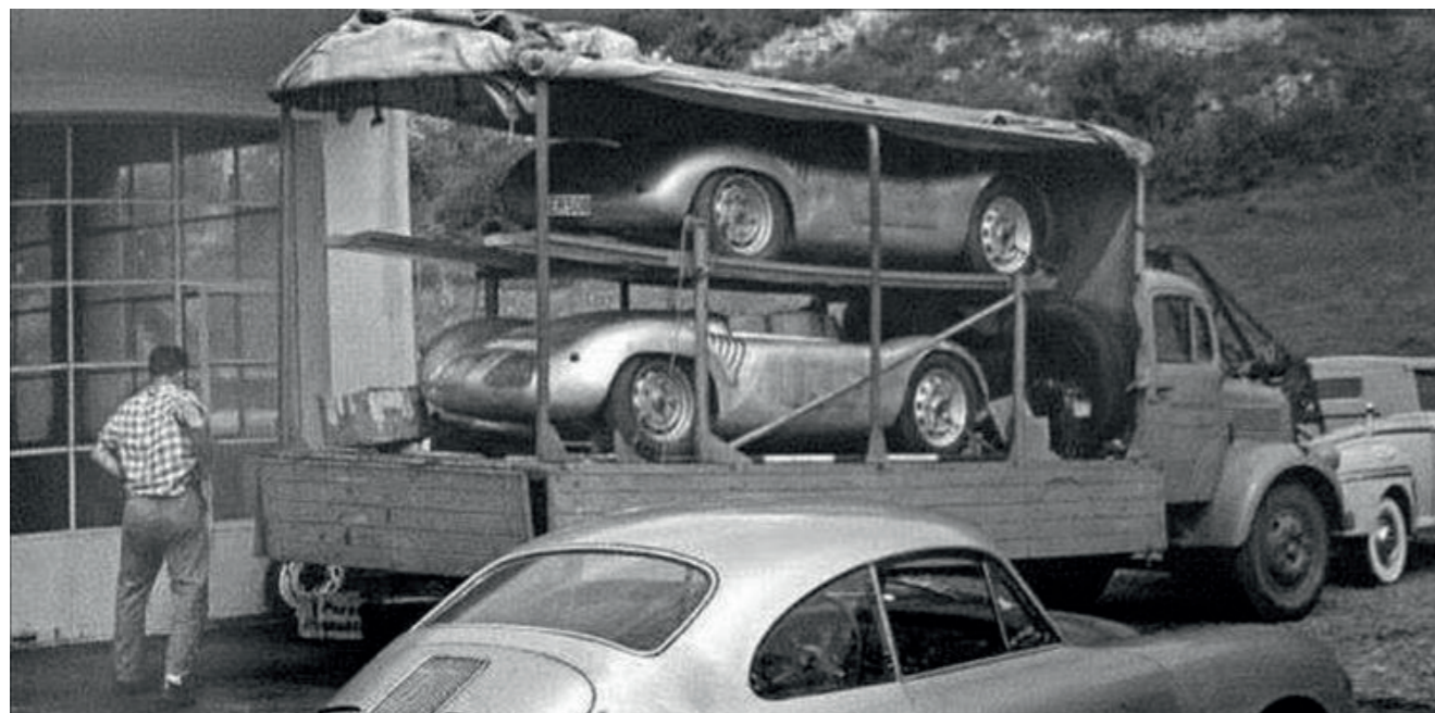
Mercedes-Benz L3500 PORSCHE mit Porsche 550 Karosserien Mercedes-Benz L3500 PORSCHE with Porsche 550 silhouettes