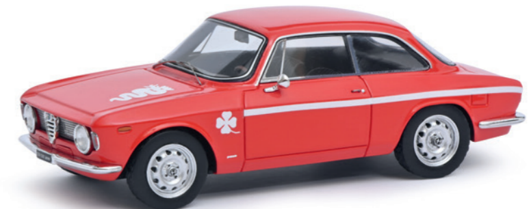
Alfa Romeo GTA