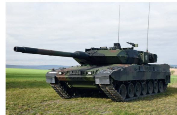
Kampfpanzer Leopard 2A7V * 45 268 0100 Tank Leopard 2A7V BW