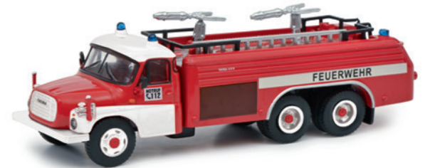
45 267 8700 * Tatra T148 Feuerwehr Tatra T148 fire brigade