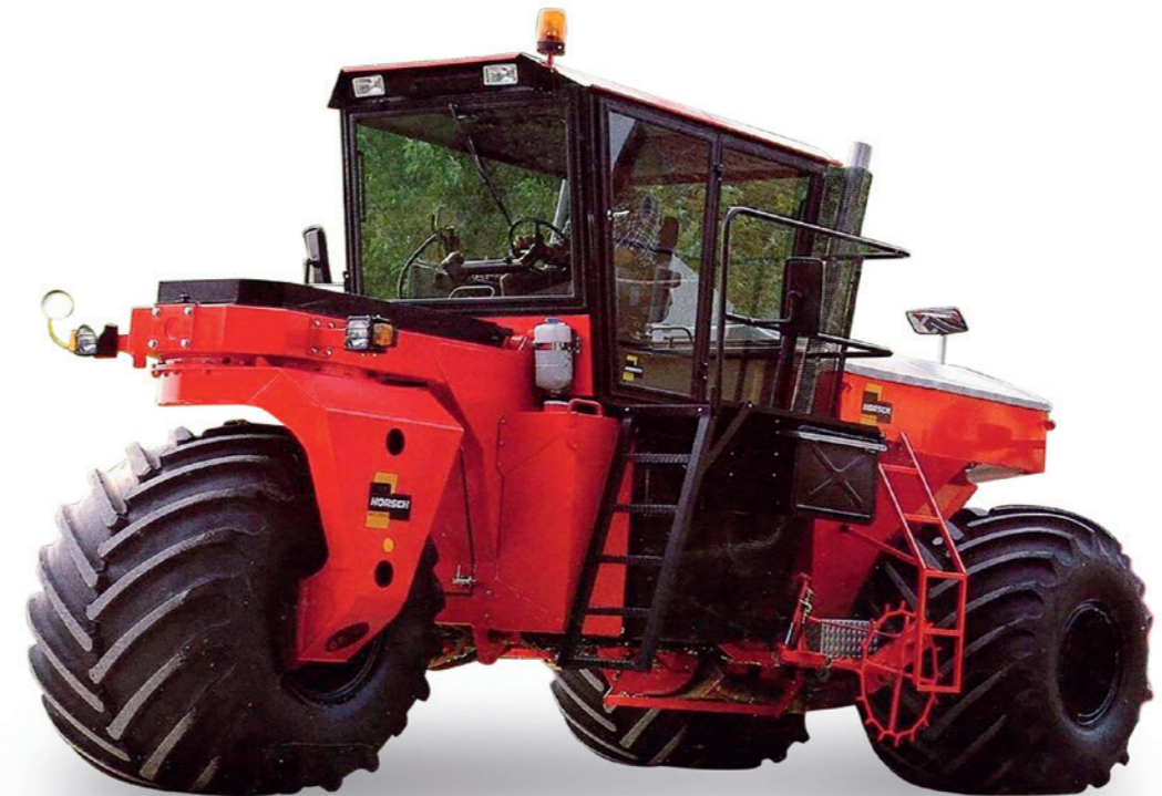
Horsch Terra Trac TT250