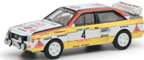
Audi Quattro A2 * 45 203 7000