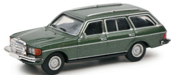
Mercedes-Benz W123 T-Modell * 45 203 8200 Mercedes-Benz W123 T-model