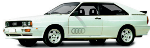
Audi Quattro ** 45 203 6900

We are proud to present the Schuco Edition 1:64, a wonderful series which provides the perfect gateway into the fascinating world of model vehicles. Edition 1:64 models come with a metal body and chassis. In addition to the accurate wheels, the Schuco 1:64 models stand out with many lovingly detailed components.