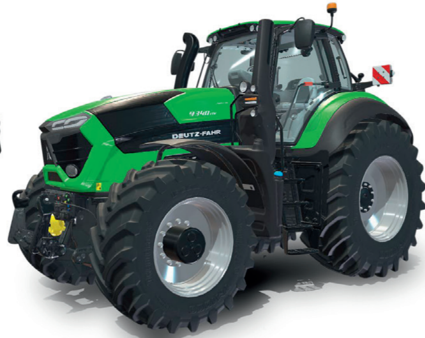
Deutz-Fahr 9340 TTV (Stage V)