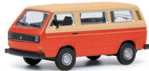
VW T3 Luxus Bus 2-tone beige/orange ** 45 203 7800