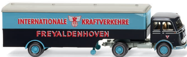
0513 24 Koffersattelzug (MB Pullman) Terminfracht und Liniendienst UVP 23,99 € · 1955-63