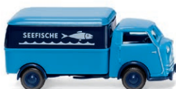
0335 06 Tempo Matador Kastenwagen Fangfrisch auf den Tisch UVP 14,99 € · 1949-52