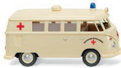
0797 29 VW T1 Bus Einstiger Standard-Krankenwagen der Ortsvereine UVP 20,49 € · 1963-67