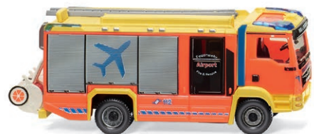
0612 43 Feuerwehr – AT LF (MAN TGM Euro 6/Rosenbauer) Löschfahrzeug im Flughafendienst UVP 40,99 €