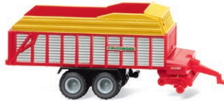
0956 02 Pöttinger Jumbo Ladewagen Spur N 1:160 Transporter für topaktuelle Schlepper-Gespanne UVP 11,99 €