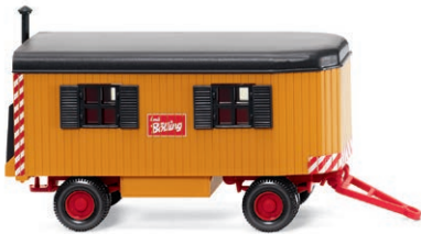
0656 08 Bauwagen Hofklassiker für Revier-Baufirma UVP 17,49 € · 1961-79