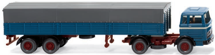
0514 05 Pritschensattelzug (MB) Güterfernverkehr in den 70er-Jahren UVP 22,99 € · 1968-74