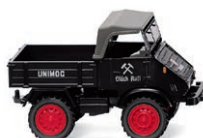
0870 67 Unimog U 411 Allrader im Bergbaueinsatz UVP 18,99 € · 1950-51