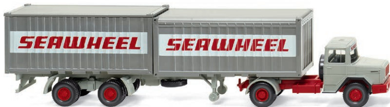
0524 02 Containersattelzug (Magirus Deutz) Eckhauber im Hafeneinsatz UVP 26,99 € · 1970-74